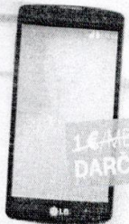
TRIPLET LG G PAD 8.0 LTE