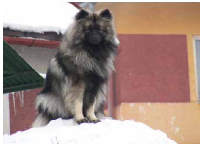
Taký je v obci len jeden.