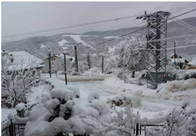
Pod ťarchou snehu.

Za rešpektovanie týchto požiadaviek zo strany vývozcu vám vopred ďakujem. Správnym separovaním domového odpadu prispejeme k skrášleniu životného prostredia našej obce Rakovnica.