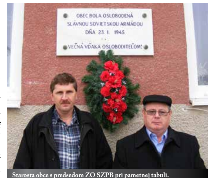
Starosta obce s predsedom ZO SZPB pri pametnej tabuli.

K cieľom našej ZO patrí predovšetkým pripomínať účasť našich spoluobčanov v národnooslobodzovacom procese a nedovoliť zabudnúť na priamych účastníkov SNP. V obci a jej okolí sa nachádzajú pamätníky, ktoré nám pripomínajú ťažké obdobie II. svetovej vojny s menami padlých našich spoluobčanov. Na znak úcty a vďaky k nim, našou snahou bude udržiavať pamätníky a ich okolie v dobrom, čistom stave. V spolupráci s obcou, ZPOZ-om a ďalšími organizáciami, ktoré v našej obci