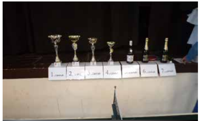
Ceny pre víťazov.