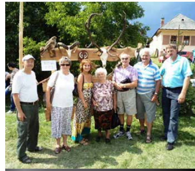
Deň sa vydaril. Bolo nám dobre.

Dňa 26. júla 2012 sme si pochutnali na chutnom GULÁŠI, ktorý sme si spoločne uvarili.