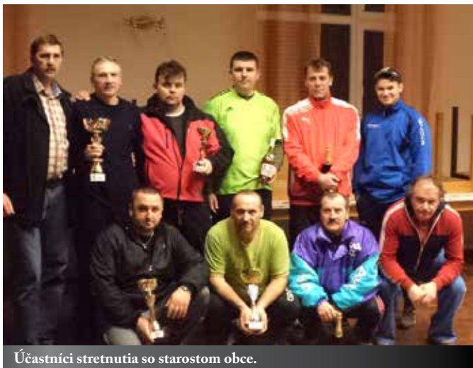
Účastníci stretnutia so starostom obce.