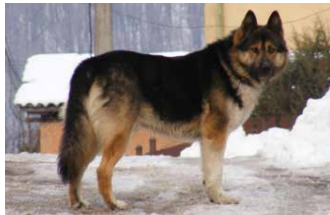
Tu strážim ja.