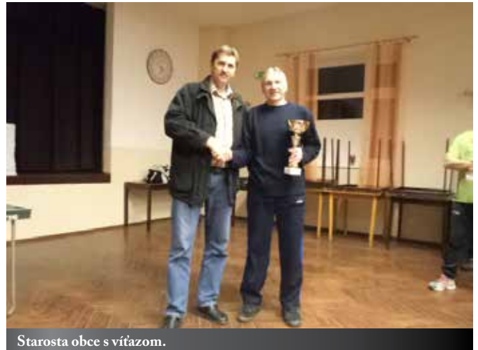
Starosta obce s víťazom.