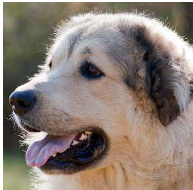
Som fešák. Však?