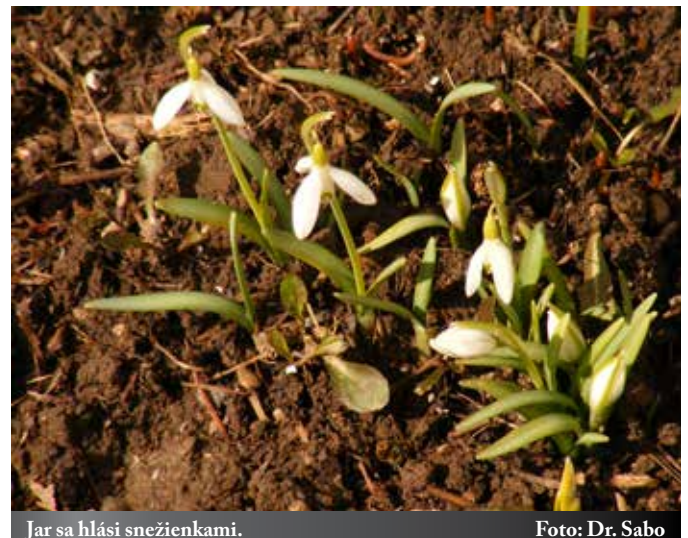
Jar sa hlási snežienkami.

„V súčasnej dobe sme svedkami priam historickej udalosti našej obce, a to dielom výstavby vodovodu v našej obci. Začiatkom mesiaca február bola podaná žiadosť o vydanie kolaudačného rozhodnutia na stavbu Vodovod Rakovnica. Po kolaudácii tejto stavby už