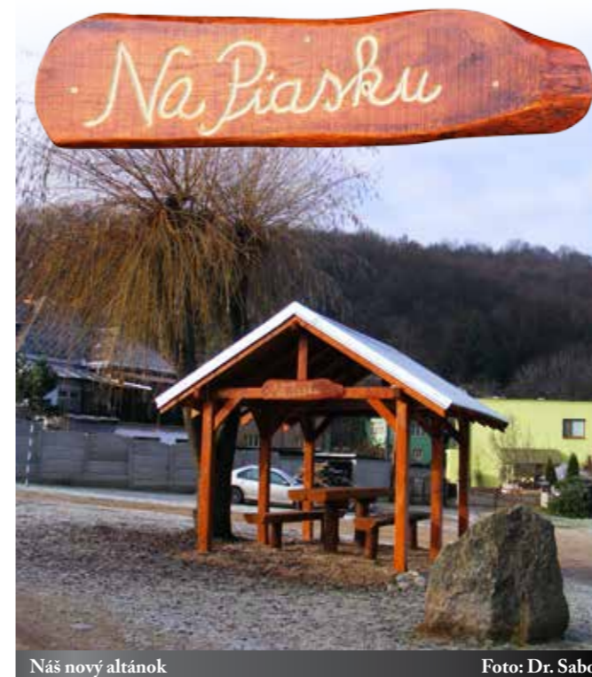
Náš nový altánok