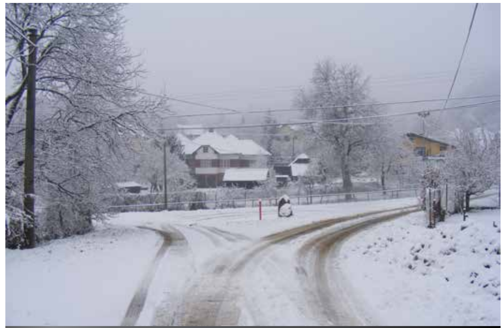
Obec po prvom snehu