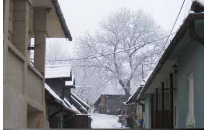
Zimný pohľad do spoločného dvora