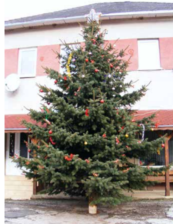
Vianočný stromček pred stacionárom