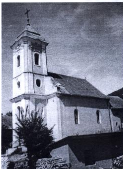
Evanjelický kostol klasicistický z roku 1836.