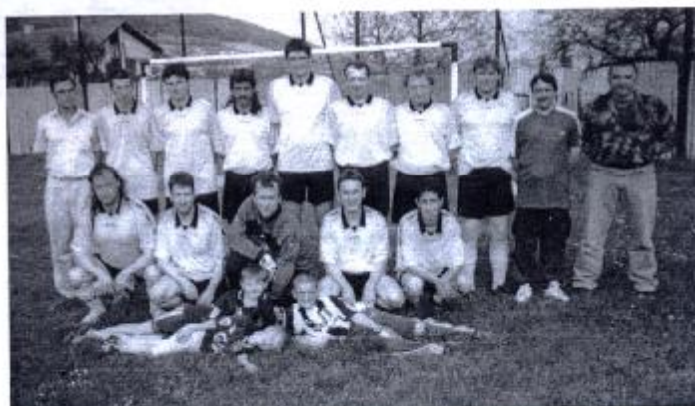
Naše futbalové mužstvo v ročníku 2001/2002.