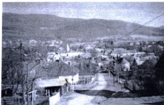
Pohľad na obce.

① Náš každodenný. Nielen chlieb je náš každodenný, ale aj taká samozrejmosť ako pozdrav. Dospelí to dobre poznajú a slušne používajú. Škoda, že niektorí mladší občania sa správajú, ako keby tu ani nežili a nikoho nepoznali.